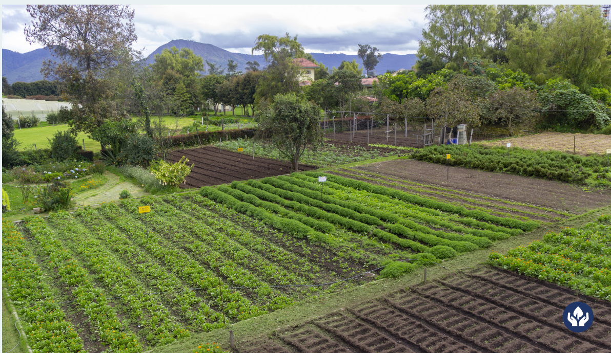
→ Jardín Medicinal Jorge Piñeros Corpas