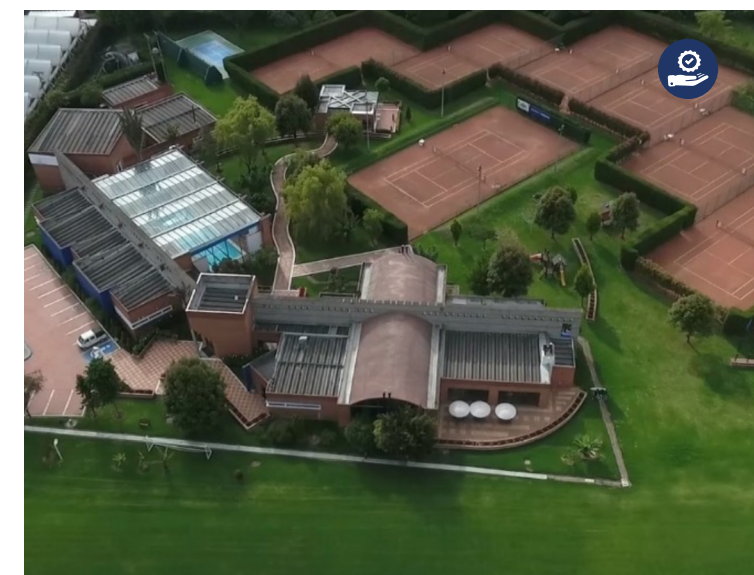
➔ The Bogota Sports Club

Adicionalmente, la Corpas invirtió en la extensión de sus instalaciones deportivas del Campus Universitario, con la adquisición de "The Bogota Sports Club", un hermoso espacio que cuenta con modernas instalaciones deportivas, entre las que se destacan las siguientes: dos canchas de fútbol profesional, siete canchas de tenis de polvo de ladrillo, una cancha de mini tenis, dos canchas de squash, una cancha múltiple, piscina, baños turcos y otras áreas de esparcimiento y recreación.